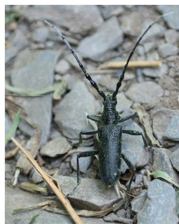
Kleiner Eichenbock (J. Sander)

Exkursionsbeschreibung: Das Weltkulturerbe Mittelrheintal ist nicht nur für seine landschaftliche Schönheit, sondern auch seine besondere Tier- und Pflanzenwelt bekannt. Die jetzt blühenden Magerrasen und Wiesen beherbergen eine reiche Rüssel- und Blattkäferfauna, die teilweise über 400 Jahre alte Krüppeleichen eine Totholzkäfer-Fauna, die in manchen Teilen nirgendwo sonst in Deutschland zu finden ist. Auf einem Rundweg in den Weinbergen rund um Burg Gutenfels schauen wir nach einigen sehr seltenen Käferarten und machen ein Picknick mit tollem Ausblick.